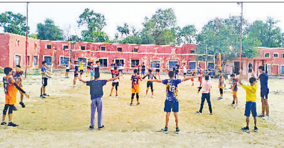
जीद। स्टैडियम में प्रैक्टिस करते बच्चे।

खेल नर्सरियों में अब खिलाड़ियों के लिए बायोमीट्रिक पंचिंग शुरू करवाई गई है। अब रजिस्ट्रेशन में भरी गई हाजिरी नाम नहीं होगी। खिलाड़ियों की ऑनलाइन हाजिरी होगी तो ही खिलाड़ियों के बैंक खाते में खुराक भत्ता आएगा। खेल विभाग द्वारा जारी आदेशों के बाद अब खेल नर्सरियों में बायोमीट्रिक पंचिंग मशीन खरीदी शुरू कर दी है। 15 अगस्त से प्रदेश की सभी खेल नर्सरियों में ये आदेश लागू हो गए हैं। प्रदेश इस समय करीब दो हजार खेल नर्सरियां चल रही हैं। इनमें 500 नर्सरियां सरकारी और 1500 के करीब प्राइवेट