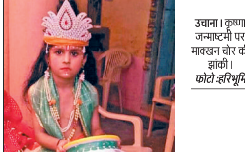
उचाना। कृष्ण जन्माष्टमी पर माखन चौर की झांकी।

नरवाना। जन्माष्टमी पर्व पर शहर के सभी मंदिर दुल्हन की तरह सजे मंदिरों में उमड़ा जनसैलाब और भगवान कृष्ण की पुजा अर्चना की और छोटे छोटे बच्चों ने नृत्य प्रस्तुत किया और मंदिर में पूजा अर्चना करने आने वाले भक्तों का मनमोह लिया। नरवाना के प्रसिद्ध बाबा तैबी साहब मंदिरएशानि देव मन्दिर डाडली खेड़ाएशिव प्राचीन मंदिरए प्राचीन हनुमान मंदिरए 'रेलवे' रोड पर स्थित सनातन धर्म मंदिरए को भव्य तरीके से सजाया गया और विभिन्न सुंदर सुंदर झांकियां सजाई गई है और महिलाएं बच्चों भारी संख्या में भगवान कृष्ण के लिए मंदिरों में जाकर उनके दर्शन कर रहे हैं और सुंदर सुंदर झांकियां का अवलोकन किया जा रहा है। जन्माष्टमी पर्व पर सारा शहर कृष्णमय दिखाई दे रहा है। मंदिरों की सजावट देखते बन रही है।