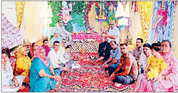
जीद। झूला झुलाने हुए श्रद्धालु।