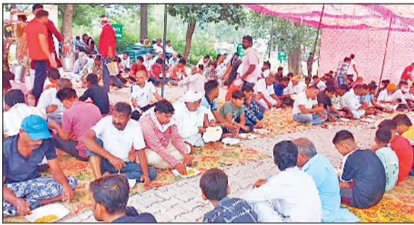
पुंडरी। भंडारें में प्रसाद लेते श्रद्धालु

ग्रामीणों का कहना था कि भारत त्योहारों का देश है। यहां प्रत्येक त्योहार अपने साथ विशेष महत्व और धार्मिक आस्था लेकर आता है। इन्होंने में से एक है श्रीकृष्ण जन्माष्टमी, जिसे बड़ी धूमधाम और