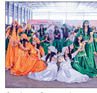
जीद। जिला स्तरीय स्वतंत्रता दिवस समारोह के दौरान सांस्कृतिक प्रस्तुति देते हुए छात्राएं।

राज्यसभा सांसद रेखा शर्मा नई अनाज मंडी में आयोजित जिला स्तरीय स्वतंत्रता दिवस समारोह में बतौर मुख्यअतिथि जिलावासियों को संदेश दे रही थीं। इससे पहले राज्य सभा सांसद ने गोहाना रोड स्थित शहीद स्मारक जाकर देश के जाने व अनजाने शहीदों को याद कर उन्हें पुष्पचक्र चढ़ा कर श्रद्धांजलि अर्पित की और उनको नमन किया। इस अवसर पर उनके साथ उपायुक्त मोहम्मद इतिहास संघर्ष और सपनों का जीवन प्रतीक है। जब जब दुश्मन ने भारत की अस्मिता पर चोट पहुंचाने का प्रयास किया है तब तब हमारे देश के जवानों ने दुश्मन को करारा जवाब देने का काम किया है।