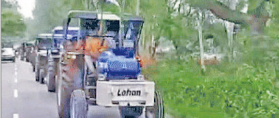
जीद। शहर में ट्रैक्टर यात्रा निकालते किसान।

भारतीय किसान यूनियन ने ट्रैक्टर यात्रा निकाली। इसमें 700 से ज्यादा ट्रैक्टर व किसानों ने भाग लिया। इसके बाद गुलकनी गांव में कार्यक्रम का आयोजन किया। इसमें अबतक जितने भी किसान आंदोलन हुए हैं, उनमें जान गंवाने वाले किसानों की पत्नी, मां तथा परिवार के सदस्यों को सम्मानित किया गया। किसानों ने 65 फीट ऊंचा तिरंगा झंडा और 40 फीट ऊंचा भाकियू का झंडा भी फहराया। रामरायें बस अड्डे से ट्रैक्टर यात्रा शुरू हुई, जो गुलकनी में किसान शहीद स्मारक पर जाकर खतम हुई। इस दौरान ट्रैक्टरों की लंबी लाइन लग गई। शहीद स्मारक पर कार्यक्रम