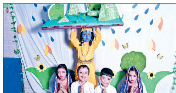
जीद। इंडस जूनियर विंग में कार्यक्रम प्रस्तुत करते बच्चे।