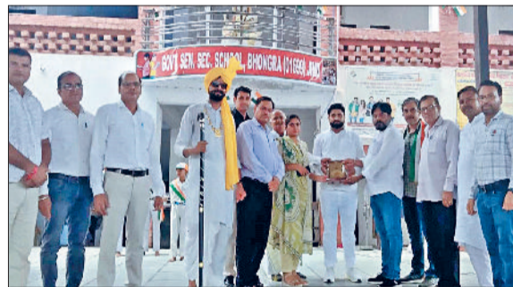
उचाना। कार्यक्रम में पहुंचे प्रमुख लोगों को सम्मानित करते हुए।

परिवार के सदस्यों को चुंदड़ी देकर सम्मानित किया। इसके अलावा भाकियू की जिला कार्यकारणी समेत 100 से ज्यादा लोगों को भी सम्मानित किया। किसानों ने मांग की कि अलेवा क्षेत्र में सरकार जो आईएमटी के नाम पर जमीन को एकवायर करना चाहती है, वह ऐसा नहीं होने देगे।