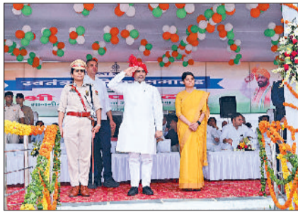
कैथल। हरियाणा के शिक्षा मंत्री महीपाल ढांडा परेड की सलामी लेते हुए।

हरियाणा के शिक्षा मंत्री महीपाल ढांडा ने कहा कि 15 अगस्त का यह दिन केवल कैलेंडर की तारीख नहीं, बल्कि वह दिन है जो हमें याद दिलाता है मां भारती के असंख्य वीरों ने अपने प्राणों का बलिदान देकर और असहनीय यातनाएं सहन कर हमें आजादी दिलवाई थी। आज पूरा भारत आजादी के उत्सव में तिरंगाभंग है। देश के प्रधानमंत्री श्री नरेंद्र मोदी व हरियाणा के मुख्यमंत्री नाथ सिंह सैनी सहित केंद्र व हरियाणा की सरकार शहीदों के सपनों के भारत के निर्माण में जुटी हैं। भारत को सशक्त, आत्मनिर्भर और विश्व में अग्रणी बनाने में सभी नागरिक योगदान दें और संकल्प लें कि चाहे कैसी भी चुनौती हो, हम अपने देश की गरिमा, उसकी अखंडता और उसकी स्वतंत्रता की रक्षा में अडिग रहेंगे।