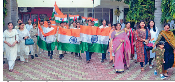
जीद। तिरंगा यात्रा निकालते हुए छात्राएं।