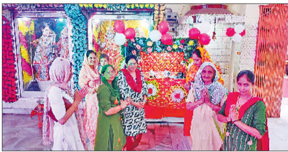
जीद। जयंती देवी मंदिर में झूला झुलाने हुए श्रद्धालु।