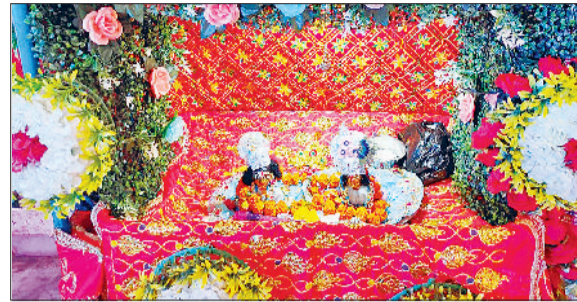
जीद। जयंती देवी मंदिर में झूले पर विराजमान कान्हा जी।

व्रत रखने वालों ने रात व्रत खोलने के लिए केला, अमरूद जैसे फलों की खरीददारी की। इनके दाम भी दूसरे दिनों की तुलना में