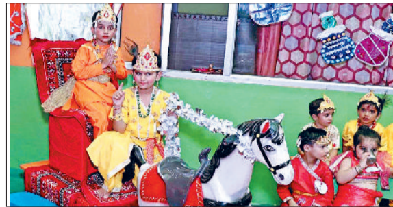
जीद। इंडस जूनियर विंग में कार्यक्रम प्रस्तुत करते बच्चे।

दुल्हन की तरह सजाया गया था। कृष्ण-राधा की झांकियों के साथ-साथ अन्य देवी-देवताओं के रूप में खड़े कलाकारों ने श्रद्धालुओं को खूब आकर्षित किया। कई मंदिरों में डीजे की धुन पर कलाकार कृष्ण-राधा बन कर एक-दूसरे को खूब रिझाते हुए नजर आए। नन्दे-मुन्दे बच्चे कृष्ण-राधा बन कर पर्व को मनाते हुए दिखाई दिए। श्री जयंती