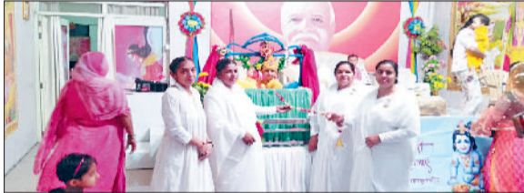
राजौद। रहमाकुमारी आश्रम में कृष्णा जन्माष्टमी उत्सव मनाते हुए बच्चे।